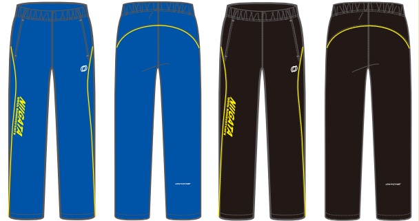
カラー：リフレックスブルー

品名：トレーニングパンツ サイズ展開：SS, S, M, L, O, XO, XXO 素材：ポリエステル100% 価格：¥4,500(税込)